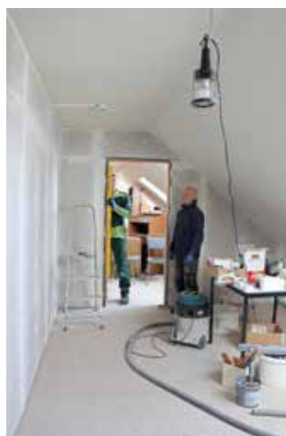
Gemeindearbeiter Enrico Franke und Klaus Eckert beim Einbau einer Tür.

Derzeit werden die letzten Arbeiten für den neuen Umkleideraum der Rettungswache in der Aula der ehemaligen Schule durch die Mitarbeiter des Trossiner Bauhofes ausgeführt. Der ungenutzte Raum im Obergeschoss der Feuerwehr und Rettungswache wurde mit Gipskartonwänden abgetrennt, erhält neuen Fußbodenbelag und neue Türen. So können in diesem abgetrennten Raum einer Größe von 6,50 mal 6 Metern 10 Spinde getrennt für Frauen und Männer für die Einsatzkräfte aufgestellt werden.